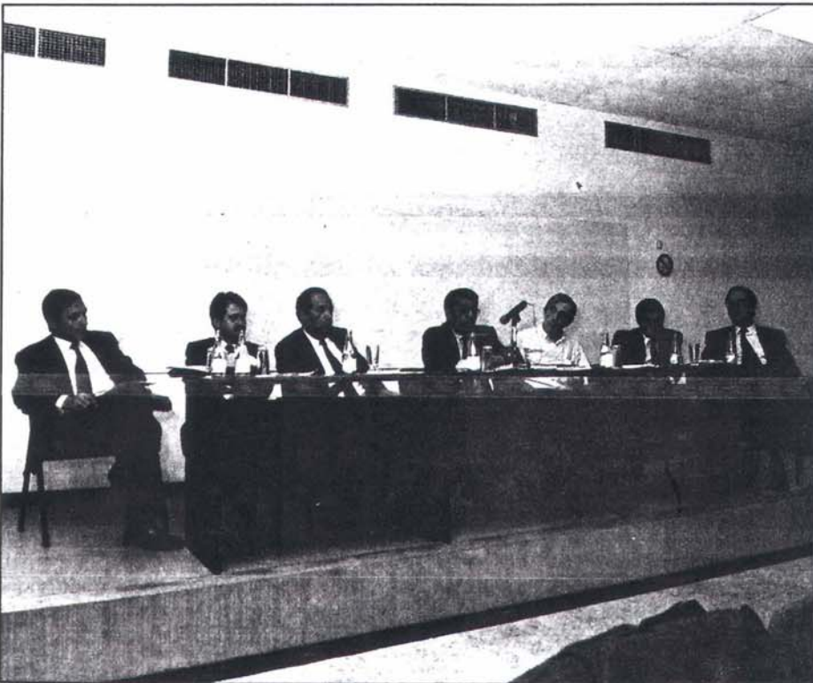
Mesa presidencial durant l'Assemblea General que va tenir lloc el mes de setembre.

S'han incorporat a la Junta de Govern d'ESADE els dos representants de l'Associació previstos, per dimissió dels anteriors representants dels antics alumnes reconeguts per l'Escola. D'altra banda, el Comitè mixt ESADE-Associació s'ha reunit diverses vegades, i han acordat, entre altres qüestions, les favorables condicions d'utilització dels serveis d'ESADE pels membres de l'Associació.