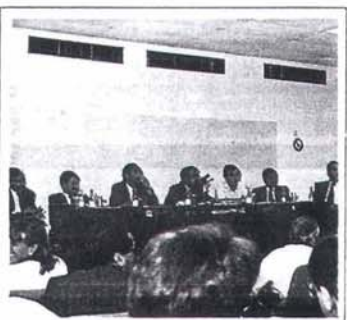
L'Associació passa comptes en Assemblea