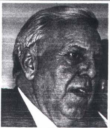
La Generalitat i ESADE han signat un conveni per a l'homologació del títol de Funció Gerencial en les Administracions Locals. (Informació, pàg.8)