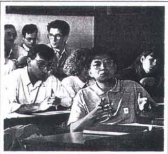
Tota la informació sobre el programa MBA