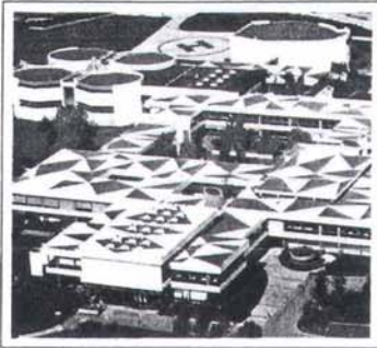
L'Associació inicia relacions internacionals