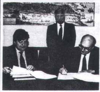
La Generalitat reconeix estudis d'ESADE