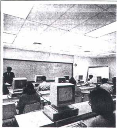
El Programa MBA ofereix formació empresarial a titulats universitaris superiors. (Tema del mes, pàg.4)