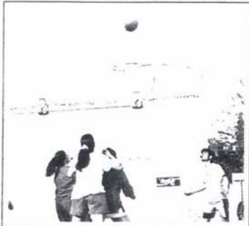
La Diada Esportiva aplegà 400 esportistes