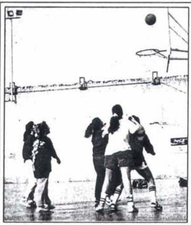
La tercera Diada Esportiva va aplegar una nombrosa representació d'esportistes entusiastes. (Alumnes, pàg.40)