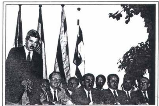
Acte de fi d'estudis 1990-91, en què es van graduar 698 alumnes. (Informació, pàg.8)