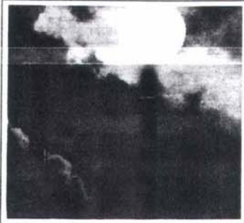
Competitivitat, economia i cultura