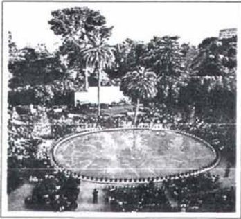
Acte de fi d'estudis del curs 1990-91