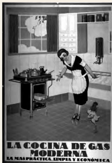
Cartel publicitario realizado por Junceda para Catalana de Gas y Electricidad S.A. Corresponde a La cocina de gas moderna, 1927.