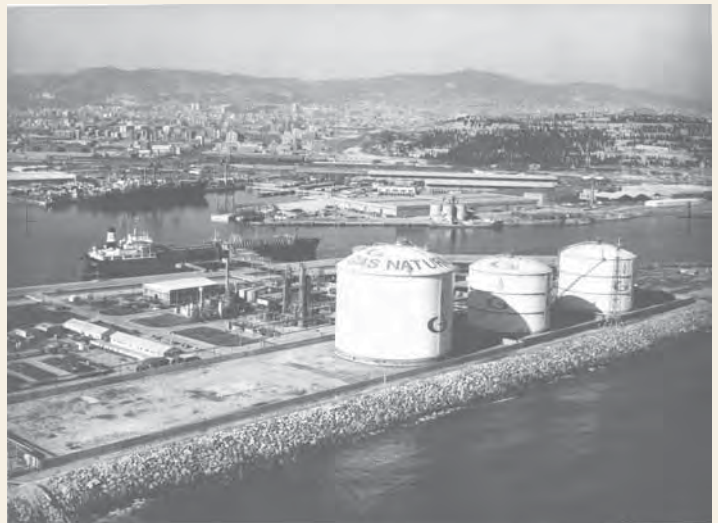
Planta de regasificación de Barcelona. Gas Natural, S.A. 1969.