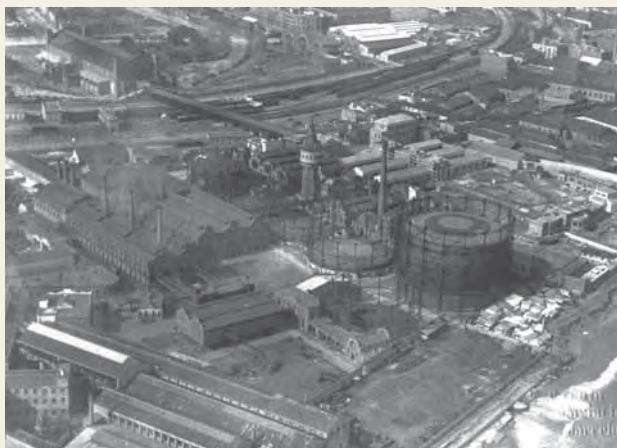
Vista aérea de la fábrica de gas de la Barceloneta. Catalana de Gas y Electricidad S.A. 1930 / c1936.

1965. Constitución, en Barcelona, de Gas Natural, S.A., por CGE, Exxon, Banco Hispano Americano, Banco Urquijo y Banco Popular Español, para importar gas natural de Libia (Marsa el Brega), y posteriormente de Argelia, construyendo una planta de regasificación en el puerto de Barcelona, y una red de distribución industrial en la zona.