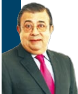
(Lic&MBA 67) presidente de honor de ESADE Alumni

Entre los asistentes había antiguos alumnos de todos los programas largos de la escuela y de la mayoría de las promociones existentes hasta aquellos momentos, así como antiguos alumnos que eran profesores o miembros de la Junta de Gobierno de ESADE. Aquella iniciativa llegaba después de treinta años de funcionamiento de ESADE, en un específico momento en que la institución académica necesitaba el soporte de sus antiguos alumnos, para seguir su brillante tarea de construcción de futuro. Los principios fundamentales de diseño de la nueva institución delineaban un modelo de asociación