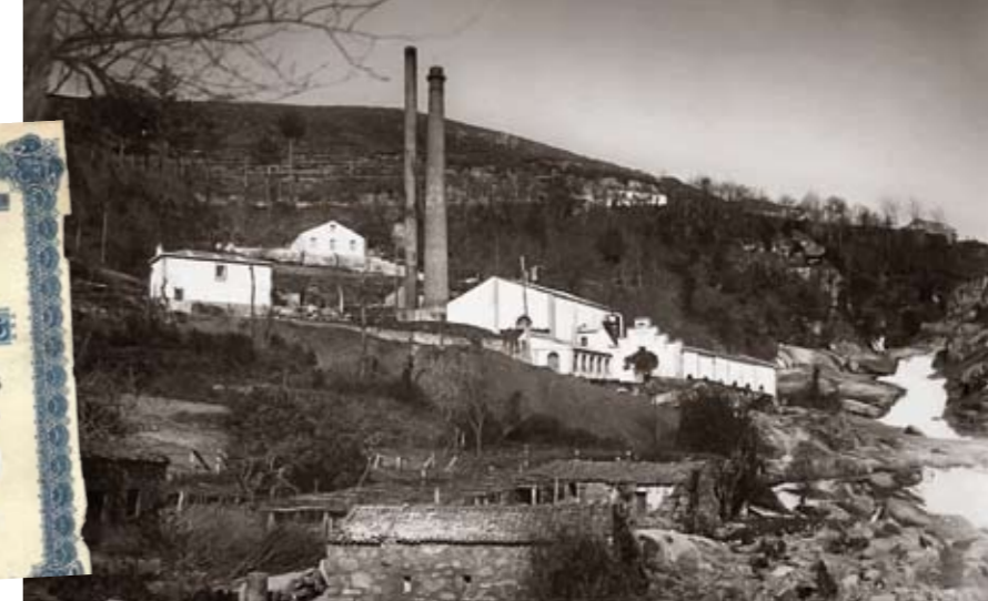
■ Obligació de la Sociedad General Gallega de Electricidad i Central de Segade. A la pàgina anterior, instal·lacions del salt d'A Ferverza, a prop de Ferrol.