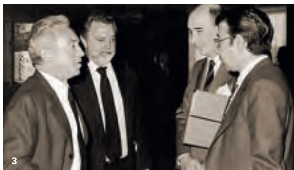
1. 1962. Avvio di un computer. 2. 1970. Inaugurazione di un impianto di Gas Natural a Barcellona. 3. 1983. Assemblea tecnica di Gas Natural. 4. 1989. Inaugurazione dell'anno