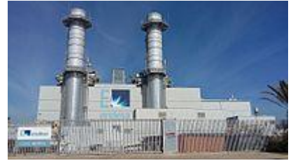
Central térmica Besós V.

La central térmica del Besós es un complejo termoeléctrico situado en la orilla derecha de la desembocadura del río Besós, en el término municipal de San Adrián de Besós, en la provincia de Barcelona (España). Las instalaciones integran dos centrales: el ciclo combinado Besós III / Besós IV (propiedad de Endesa y Gas Natural Fenosa, respectivamente) y el ciclo combinado Besós V (Endesa). 1 Los grupos actuales han sustituido a los de ciclo convencional previamente existentes (Besós I y II) que, a su vez, reemplazaron la central térmica original, de 1917.