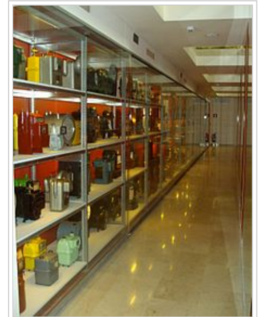
Colección Catalana de Gas, ubicada al lado del Archivo Histórico.