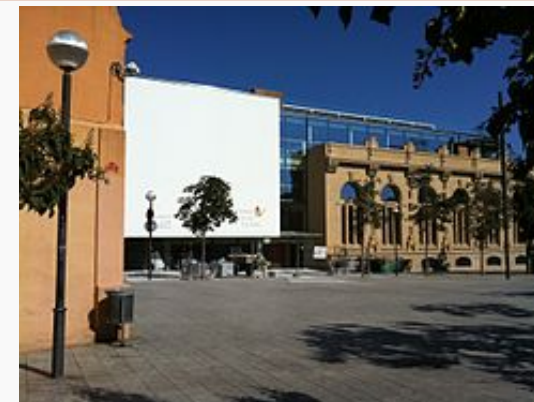
Obras de rehabilitación del edificio del museo