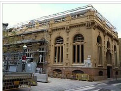
Obras de rehabilitación en el antiguo edificio de la fábrica de gas durante abril de 2011.

El Museo del Gas ocupa un conjunto de dos edificios adyacentes que se encuentran en la plaza del Gas de Sabadell, entre las calles de San Pedro y Abogado Cirera. 10 El edificio más antiguo, en la esquina con la calle de San Pedro, es una construcción de 1899 de Juli Batllell, discípulo de Gaudí y uno de los referentes locales de la arquitectura modernista. Se edificó como fábrica de la empresa La Energía, en la plaza del Duque de la Victoria (en referencia a Espartero), actual plaza del Gas. La fábrica producía electricidad a partir de motores de gas. 9 Años después La Energía se fusionó con Gas de Sabadell, la cual fue posteriormente absorbida por Catalana de Gas y Electricidad. En 1941 la fábrica cerró, pasando Sabadell a ser abastecido desde Barcelona. 11